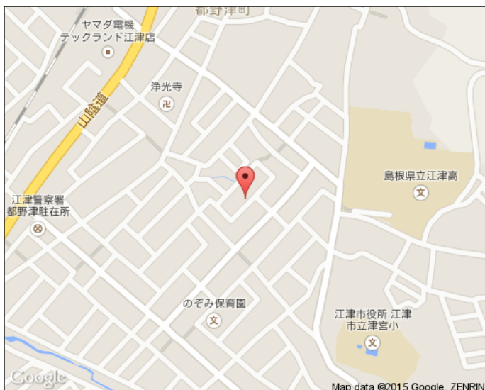
※図面と現況が異なる場合は、現況を優先させていただきます。